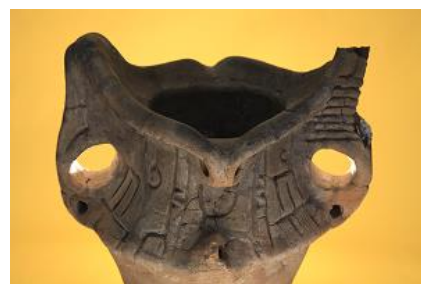
〈下野谷遺跡出土土器〉