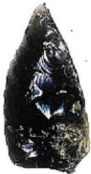
〈鈴木遺跡出土石器〉