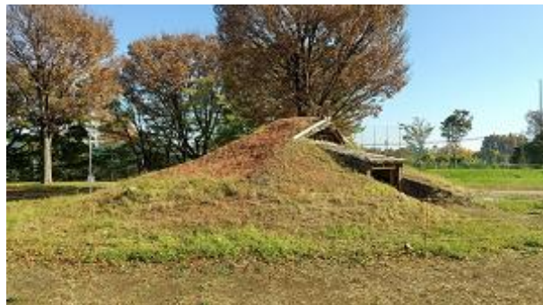
〈下野谷遺跡出土住居〉