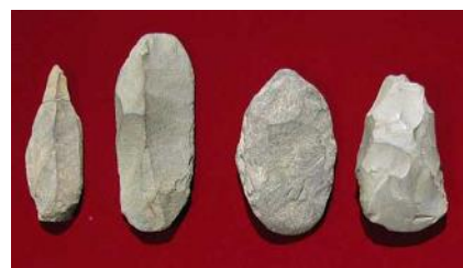
〈鈴木遺跡出土石器〉

申込み 1月10日(金)まで(月曜日を除く)の午前9時から午後5時までに、 花小金井南公民館へ(電話可)、申込み多数の場合は抽選し、1月11日(土) 以降、全員に結果を連絡します。