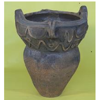
〈下野谷遺跡出土土器〉