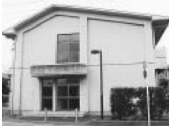
被災者一時生活センター(小川東町五丁目)