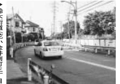
鈴木街道花小金井南町三丁目

③都内では3区、2市で実施している。交通安全思想の普及等が目的であり、自転車免許証交付対象も小学生を主体に行っている。平成16年には市内の小中学校で自転車教室を10回開催し、多くの受講があることから、現段階では考えていない。