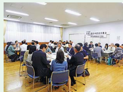
▲東部市民センターの意見交換会の様子

今後も市民の皆さんとの意見交換の機会を定期的に設けていきます。多くの方のご参加をお待ちしております。