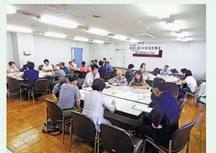
▲中央公民館の意見交換会の様子