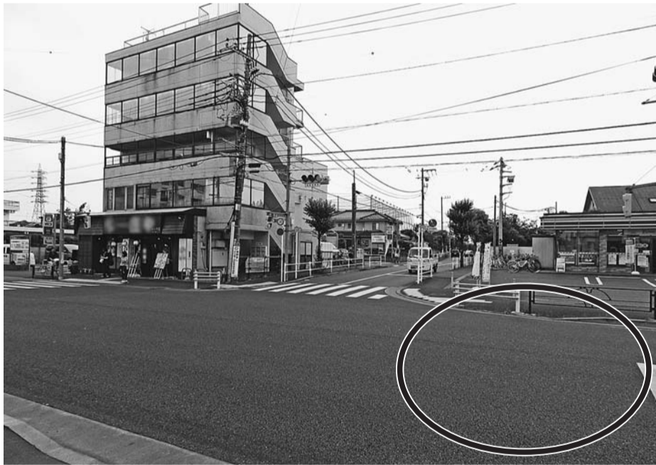
新小平駅南側の青梅街道と山王通りの交差点西側部分

質問 ①改元に当たり婚姻届を提出する人に特別なサービスを実施したり、庁舎に記帳所を設けるなどした自治体も多いが、小平市で実施したことは。