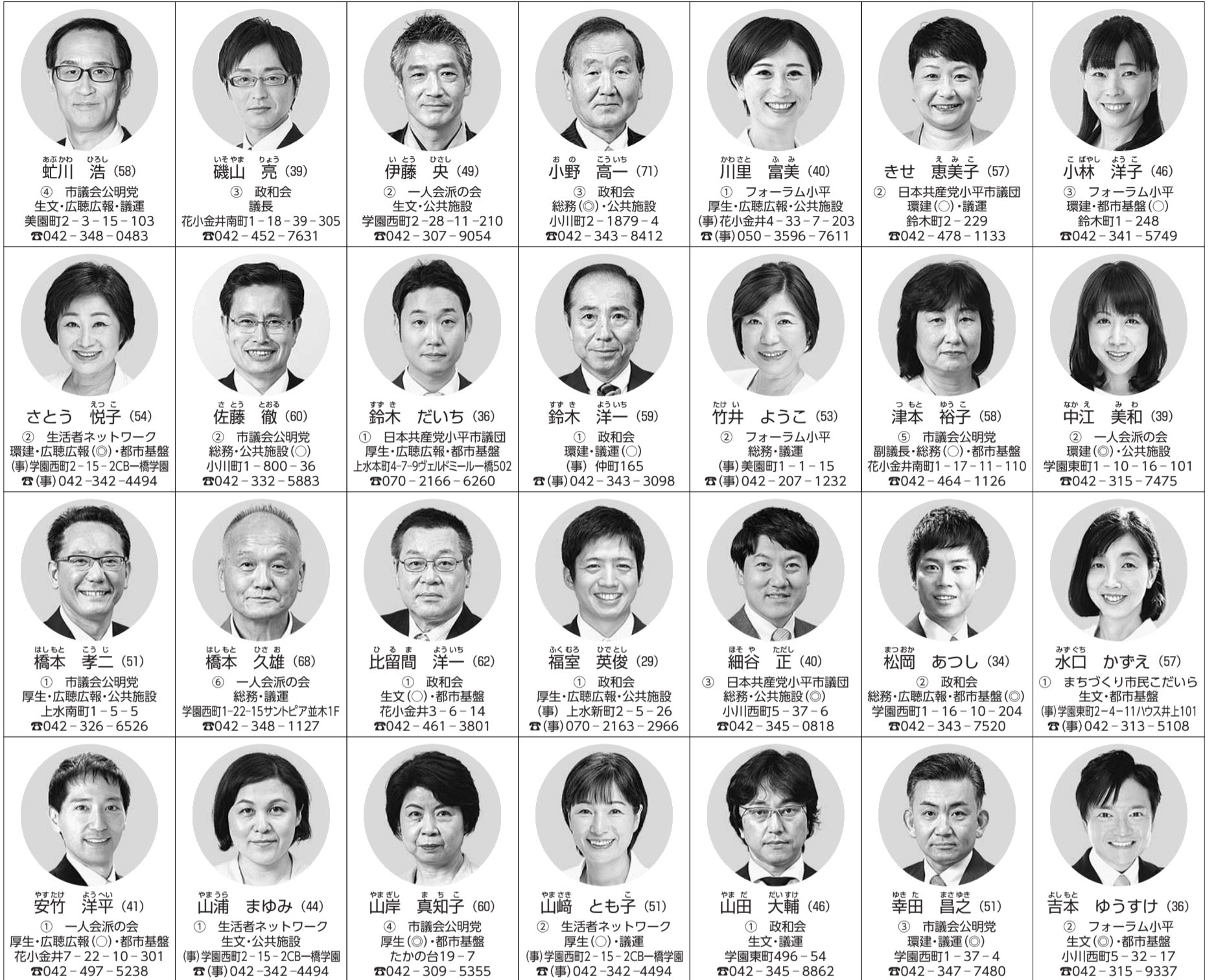
写真 氏名(年齢は発行日現在) 当選回数 会派名 常任委員会・特別委員会等 住所(事)は事務所 電話番号

総務=総務委員会、生文=生活文教委員会、厚生=厚生委員会、 環建=環境建設委員会 広聴広報=広聴広報特別委員会、 都市基盤=都市基盤整備調査特別委員会、 公共施設=公共施設マネジメント調査特別委員会 議連=議会運営委員会 (◎=委員長、○=副委員長)