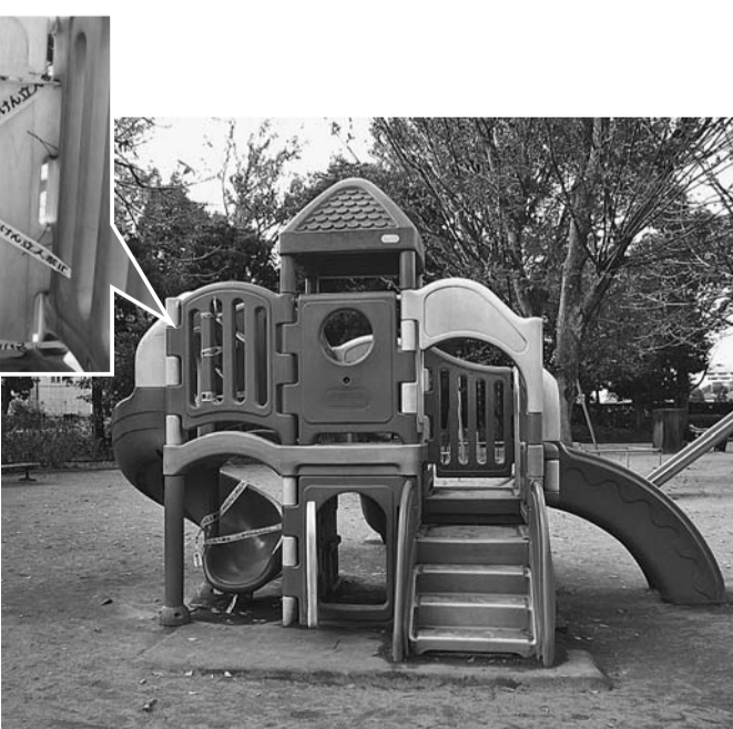
破損部を閉鎖した東部公園の遊具

教育長 進学前に中学校教員が小学校訪問し情報共有等している。スクールソーシャルワーカー配置で直接的支援を小・中学校を見通し継続的に行っていく。