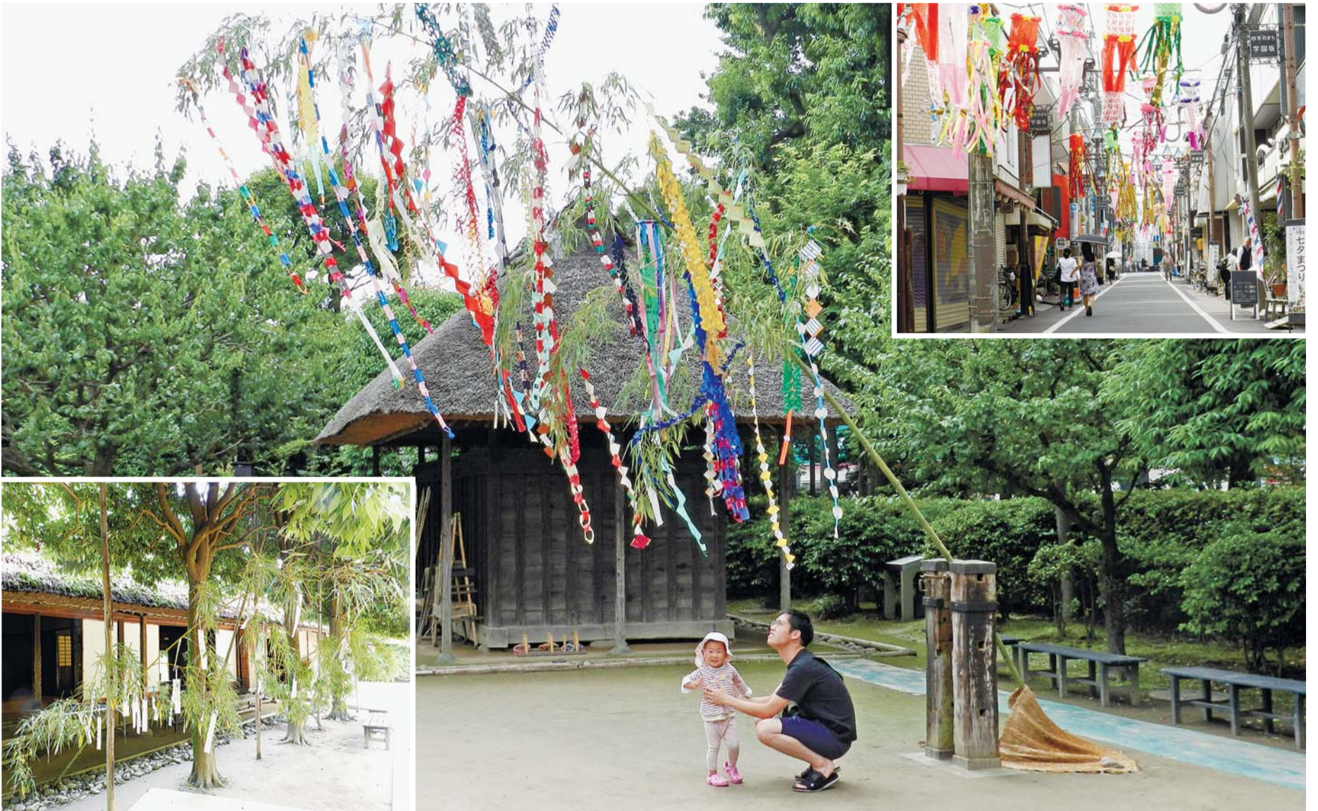
小平の夏を彩る風物詩 (小平ふるさと村、学園坂商店街)

4月の一般選挙後、初の臨時会を5月20日に開催し、議長・副議長を初めとした議会人事を決定しました。また、小平市監査委員の選任議案など2件の市長提出議案を同意、可決したほか1件の市長専決処分を承認しました。また、議員提出議案は、特別委員会の設置など4件を可決しました。