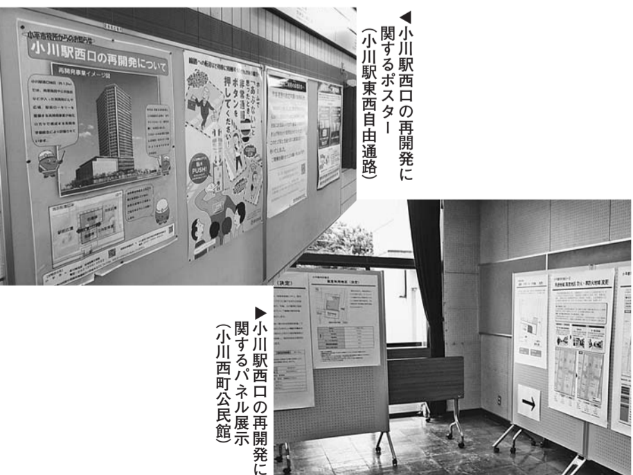
小川駅西口の再開発に関するポスター(小川駅東西自由通路)