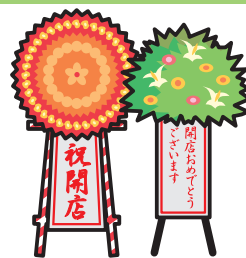
落成式・ 開店祝いの花輪