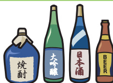
町会の集会や 旅行等の催し物への 寸志や飲食物の 差し入れ