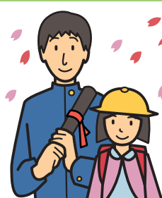
入学祝い・卒業祝い