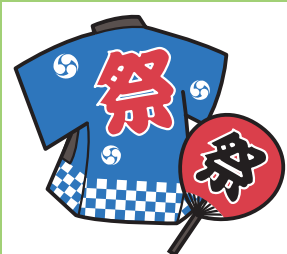
お祭りへの 寄附や差し入れ