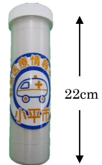
<救急医療情報キット>