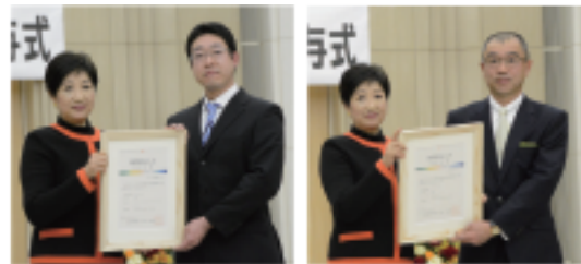
東京都GAP認証証書授与式の様子