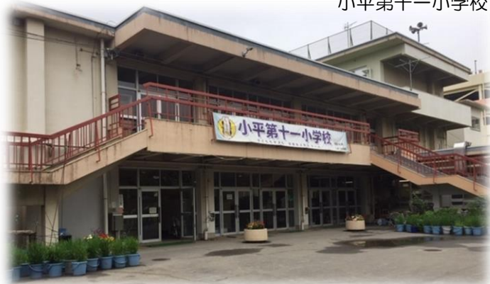
小平第十一小学校

小平市の公共施設マネジメントでは、公民館や地域センターなどの地域学習、コミュニティ機能を、学校建て替えの際に複合化することにより、“小学校を地域の核”とした地域コミュニティの醸成を図っていくことを目指しています。