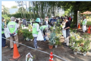
市民による公園の活用