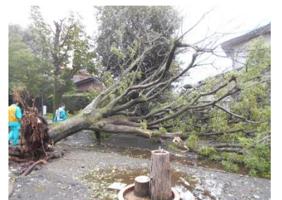
公園における台風による倒木被害

市民団体等による公園や樹林地の維持管理や自然とのふれあいの促進等の様々な活動の発展を図るとともに、地域のみどりのまちづくりを担っていく人材の発掘・育成等が必要です。