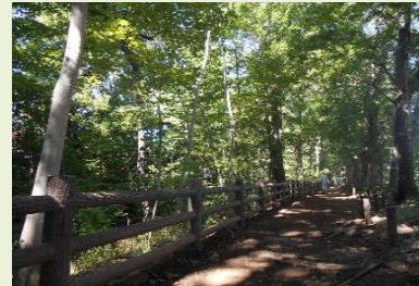
小平グリーンロード