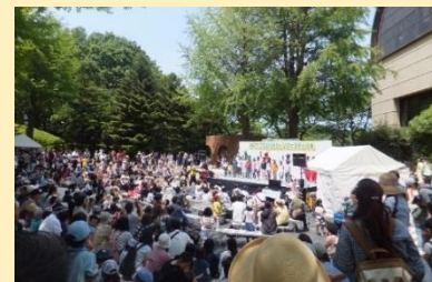
グリーンフェスティバル