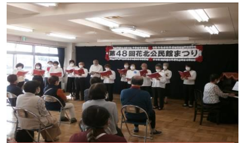
花小金井北公民館