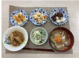
茹で団子、焼き団子、みたらし団子のタレ、けんちん汁、手羽と大根の煮物、青菜の白和え

は、近所のスーパーで分量など迷いながら購入しています。普段慣れない買い物に今も苦戦しています。調味料の準備は、公民館の近くにいらつしやる会員さんのご苦勞に頼っています。感謝です。炊飯器を配備して頂き、公民館の皆様に変お世話になっております。最近の写真も載せておきます。台所に立つ機会が増えて、料理づくりを楽しんでいます。