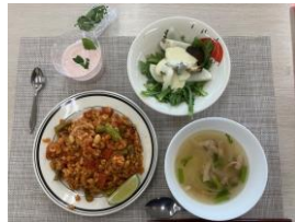
チキンのソテー、春菊と長芋のサラダ、春菊の茎のスープ、いちごのフロア

活動日 第一木曜日 時間 午前11時〜午後2時 会費 月1千円(材料費は千円弱) 問合せ 西田 nsdkys@gmail.com