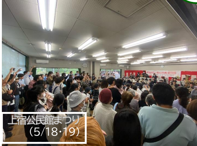
上宿公民館まつり (5/18・19)