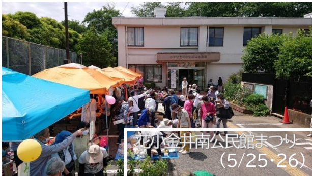
花小金井南公民館まつり (5/25・26)