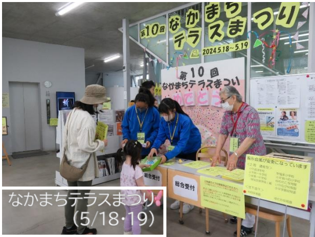
なかもちテラスまつり (5/18・19)