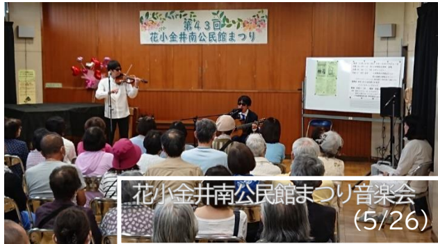
花小金井南公民館まつり音楽会 (5/26)