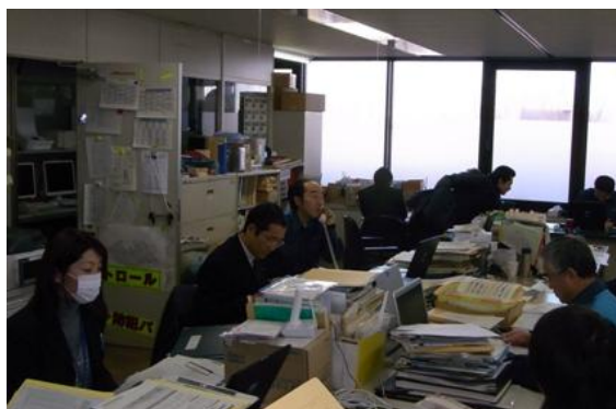
電話による問い合わせ等への対応

また、市民からの問い合わせ等が膨大となり(代表電話の日中の着信件数が、地震前の1日当たり500件程度から、計画停電発表後では3,000件程度へと増加)、これに対応するため、3月15日(火)以降、4月8日(金)まで、土曜、日曜及び祝日も含め、市民生活部防災安全課(災対調整部本部班)の職員のほか各日3名程度の応援職員により電話対応を行った。これに加えて、3月16日(水)から31日(木)までの間は、東京電力から電話対応のための職員の派遣を受け、1日1~2名、延べ30名が電話対応に当たった(計画停電に関する問い合わせに限らず、市職員の指導のもとで、救援物資の受付に関するもの等も含めて問い合わせ全般に対応)。