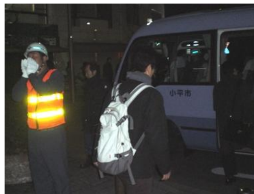
新小平駅での帰宅困難者の誘導

地震発生の当日、鉄道が不通となったこともあり、都内各所で帰宅困難者が大量に発生し、東京都では都立学校等を帰宅困難者対応施設として開放するとともに、各市区町村に対して受入対応の指示がなされた。小平市では、同日18時頃からJR新小平駅に帰宅困難者が滞留し始めているとの情報を受け、このことへの対応として、新小平駅周辺で100人規模の宿泊が可能な施設として小平第六小学校への受入れを決定し、20時頃に、緊急初動要員市役所隊により、新小平駅からマイクロバスで帰宅困難者を移送するとともに、市庁舎備蓄庫及び西部市民センター備蓄庫から毛布100