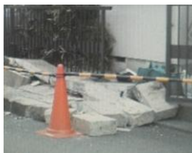
地震によるブロック塀の倒壊 (小平市北部)