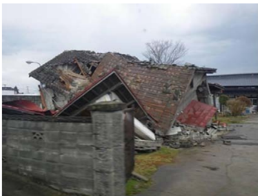
宮城県内陸部(4月16日(土))