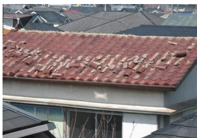
地震による屋根瓦の破損 (小平市中部)

※上記のほか、市庁舎における天井ボードの落下、市立学校におけるガラスの破損等、市施設における被害が生じている。