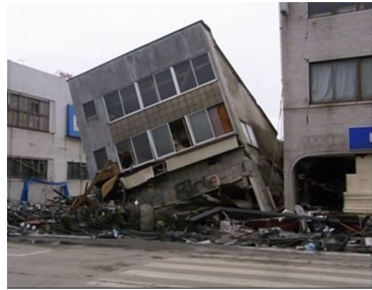
岩手県釜石市(3月21日(月・祝))