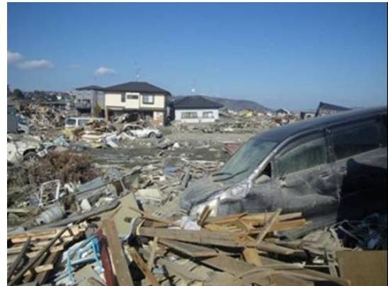
宮城県石巻市(4月16日(土))