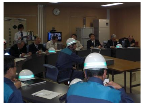
第1回本部会議の様子