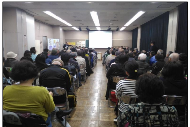
市民説明会の様子