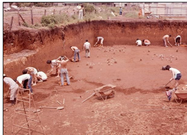
鈴木遺跡発掘調査