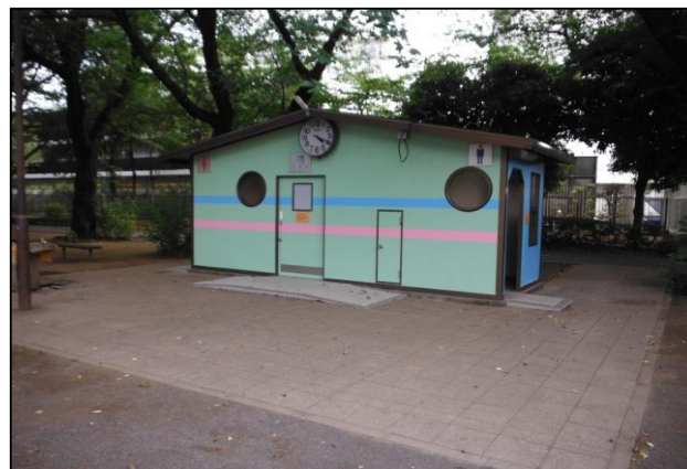
平成29年度に全面改修した「たけのこ公園」のトイレ