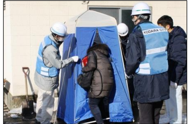
整備されたマンホールトイレの設置訓練を行う様子