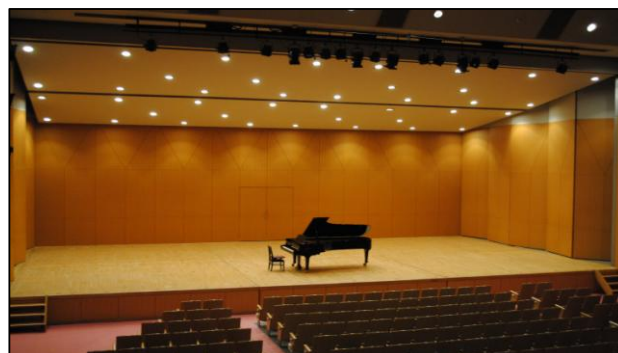
ルネこだいら中ホール