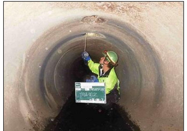
下水道管きよの調査の様子