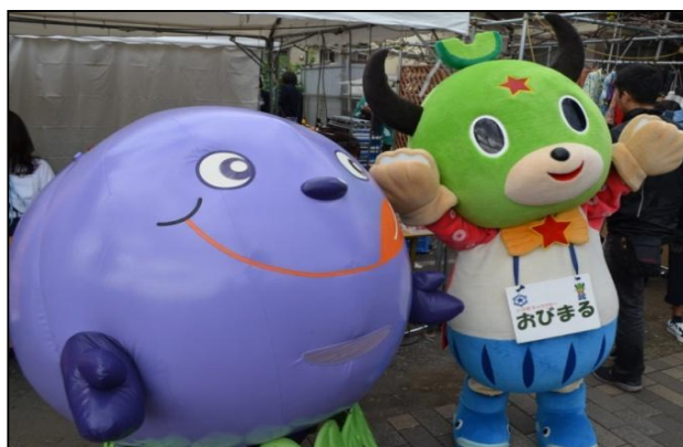
小平町のマスコットキャラクター「おびまる」と、小平市のマスコットキャラクター「ぶるべー」