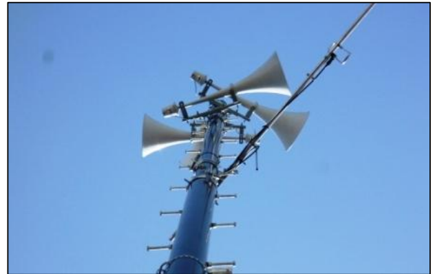
平成27年度に整備した防災行政無線