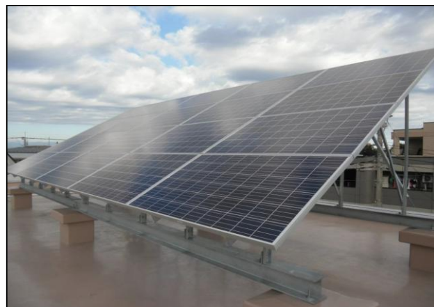
天神地域センターに設置された太陽光発電設備