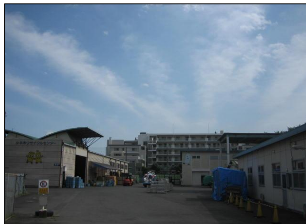
現在のリサイクルセンターの様子