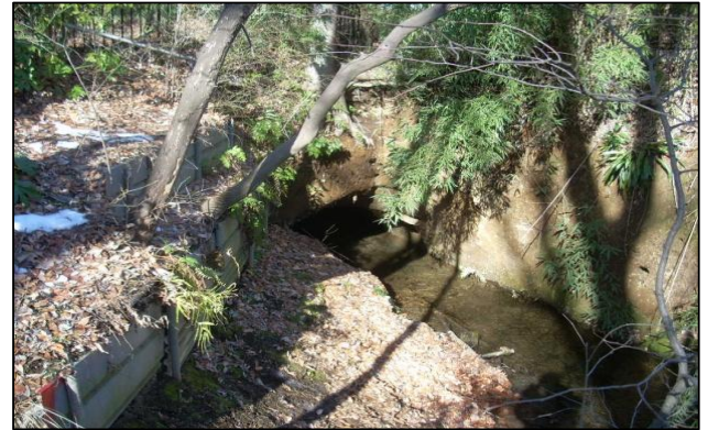
新堀用水のり面（胎内堀）の様子