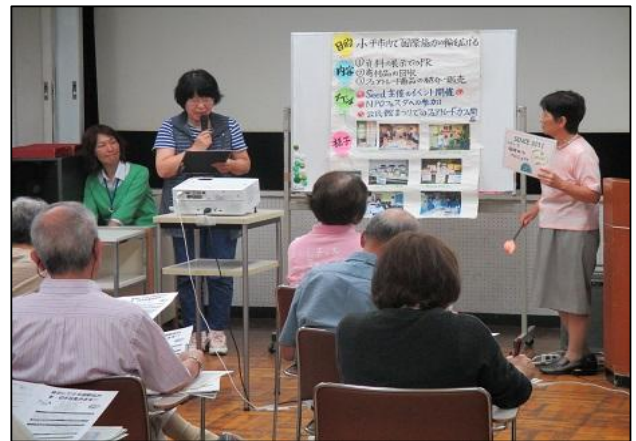
地域のつながりづくり講座の様子