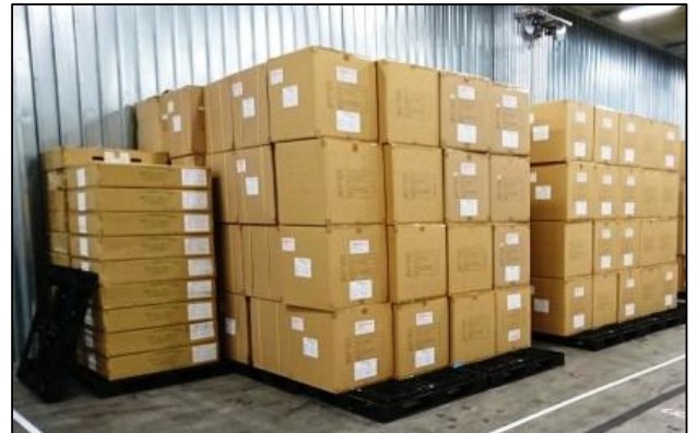
避難者に配布される食料や避難所開設のための資機材