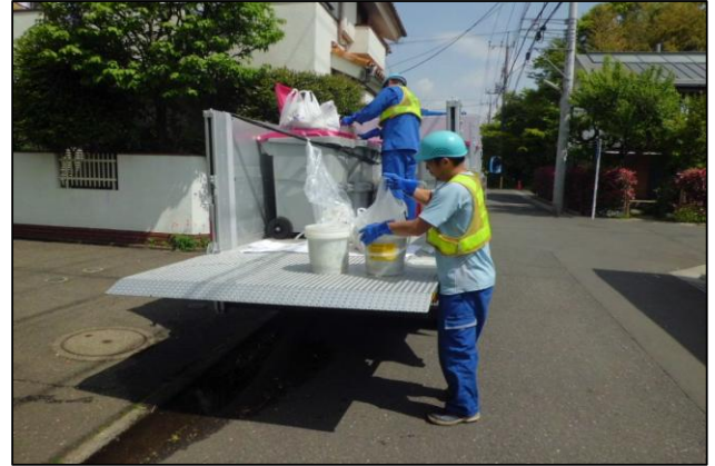
食物資源（生ごみ）回収の様子