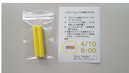
配布物 (チョークと案内)

イエローチョーク作戦とは、道に放置されている犬のフンを減らす方法として、フンの周囲を黄色のチョークで囲い、目立たせることで、飼い主に意識付けする取組です。平成 30 (2018) 年 3 月から市内 NPO 法人の協力のもと実証実験を実施しました。平成 30 (2018) 年 5 月からは本格実施に移行し、ご協力いただける市民の皆様にもチョークと案内を配布しています。