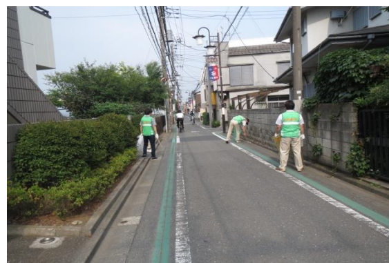
事業所による清掃活動