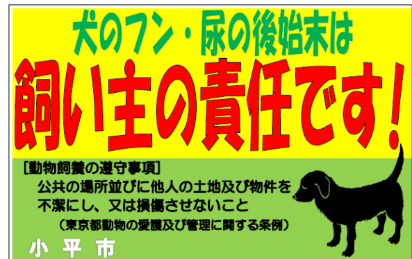
犬のフン持ち帰り啓発看板