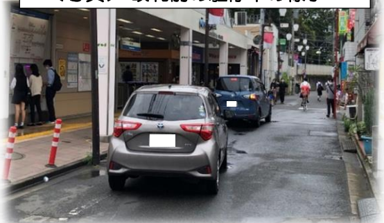
<写真> 改札前の駐停車の様子

しかし、右写真のように、改札前に駐停車する車両があると、歩行者にとって危険な状況になることや、禁止区域に駐停車車両が頻繁に見受けられることから、今回の整備ではこれまで無かったタクシーや一般車両などが停車できるスペースを駅前広場内に設けることとしています。