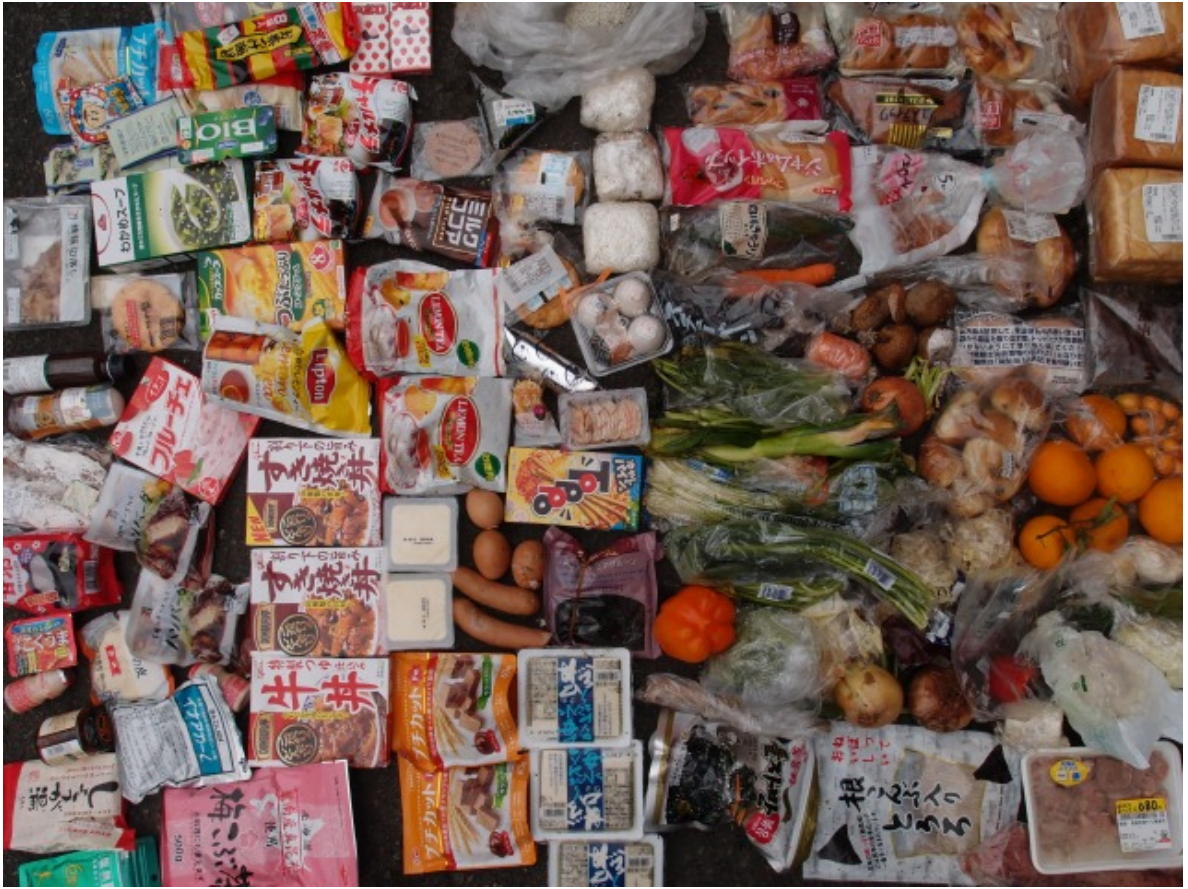
写真5-1 ごみとして廃棄された未利用食品