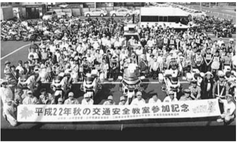
平成22年秋の交通安全教室参加記念

春の全国交通安全運動期間中、市では協力団体と合同で、市民を対象とした交通安全教室を開催します。自転車の乗り方やルールをわかりやすく説明します。 また、子どもを対象にした自転車実技教室、二輪車実技教室(オートバイは各自持ち込み)も行います(記念品あり)。 とき 5月15日(日) 午前9時から ところ 新東京自動車教習