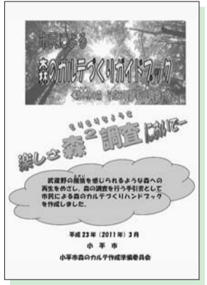
森のカルテづくりガイドブック

市では、武蔵野の風情を残す雑木林の森を次の世代に残すため、市民の皆さんが森の環境と動植物の調査を実施し、記録するためのガイドブックを作成し