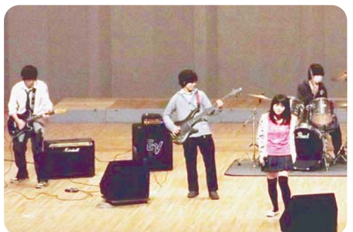
昨年度の青少年音楽祭の様子

歌うことや演奏することが大好きで、練習を重ねているけれど発表する場がないという青少年の皆さん、ぜひ参加してください。 とき 10月14日(日) 午前10時～午後4時30分 ところ ルネこだいら大ホール 費用 無料 対象 次のすべてに該当する団体 ▽小平市に属する青少年グループ(小学生以上) ▽代表者会議(2回)に出席できる ▽音楽祭当日、どの時間帯でも出演できる ※演奏形態(カラオケによる伴奏は除く)、ジャンルは問いません。 募集団体 20団体 代表者会議 ▽第1回:9月8日