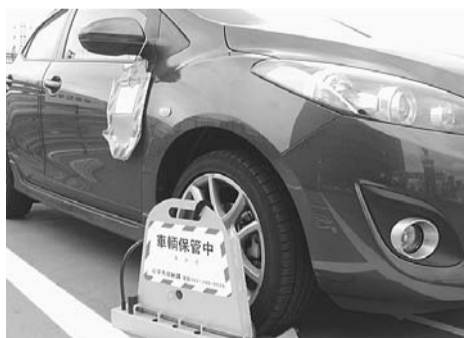
タイヤロック装置による自動車の差し押さえの例