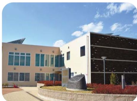
小川町一丁目地域センター・児童館の外観

地域センターと児童館を併設した市内で3館目の施設が開館します。地域センターとしては19番目、児童館としては3番目の施設です。地域社会の交流の場として、子どもたちが安心して遊べる場所として活用してください。