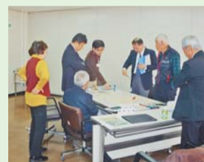
「小平南東部地域コミュニティタクシーを考える会」の検討会議の様子