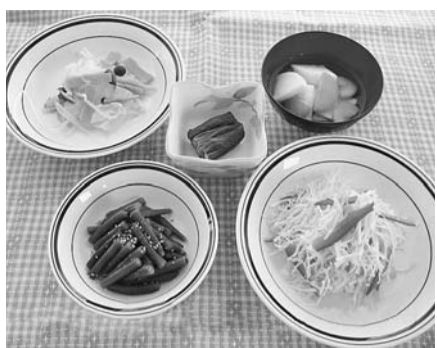
野菜料理 1日5皿で、約350グラム

毎日の元気は、バランスのよい食事から。大人が一日に必要な野菜の摂取量は350gと言われ、これは日本人の平均摂取量にもう一皿加えた量に相当します。一日5皿