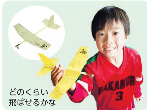
どのくらい 飛ばせるかな

●学習講座 ストロングライダーを作ろう ほかに沼や池の微生物を観察します。 とき 3月18日(土) 午前10時30分~正午 対象 小学生(親子可) 定員 30人 持ち物 筆記用具 申込み 3月17日(金)までに、問合せ先へ(電話可、先着順)