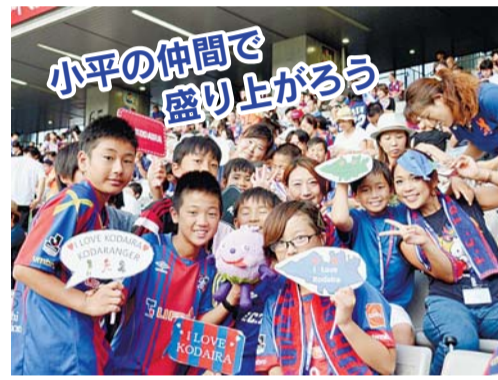
小平の仲間 盛り上がる

抽選) ※当選者には、チケット引き換えに 必要な認証番号を電子メールで通知 します。その後、ロソンまたはミ ニストップで発券してください。(発 券手数料1枚当たり2百16円)。