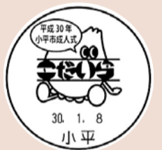
成人式オリジナル消印