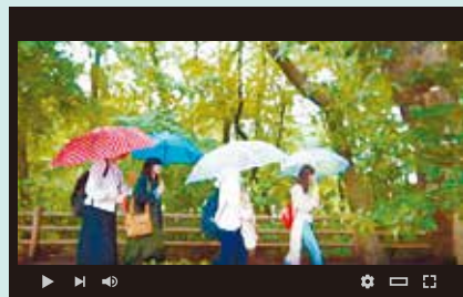
めぐりん小平 玉川上水さんぽ編

実際に動画の撮影に参加した人に、動画の制作を通して見つけた小平の魅力について伺いました。