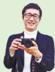
撮影を担当 佐藤洋輔さん

親子3人が、狭山・境緑道を自転車で行きながら緑道沿いの施設やお店を巡ります。緑道の景色とともに、家族でも楽しめる小平の自然や文化、食が紹介されています。