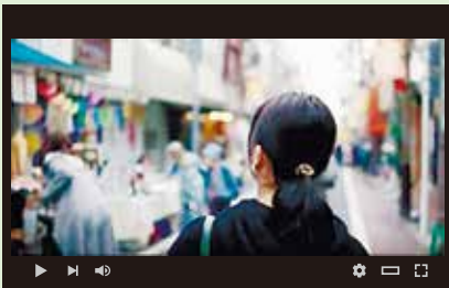
プチーナ ガクエン サカ ストリート petitina gakuen zaka street (学園坂商店街編)

こだいら観光まちづくり協会では、まちを紹介する動画と、市主催のイベントなどの動画を公開しています。市民が主役の動画を心がけ、商店街で働く人や学生などさまざまな立場の市民が参加しています。