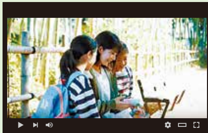
めぐりん小平 狭山・境緑道 サイクリング編

主人公が、たまたま立ち寄った学園坂商店街で人々の笑顔やあたたかさに触れ、小平の良さを発見します。学園坂商店街の店舗や、音楽活動をしている方など、多くの市民が登場しています。