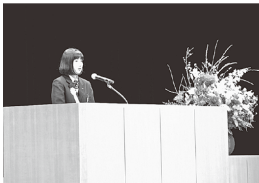
発表生徒・テーマ (予定)

市内中学校9校の代表生徒9人が自由テーマで意見を発表します。中学生の健全な成長を願って、率