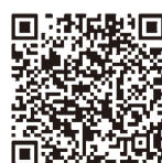
指定収集袋取扱店 QRコード

2月21日(木)から、燃やすごみ用、燃やさないごみ用、プラスチック製容器包装用の指定収集袋を、市内、小平市近隣のスーパーマーケット、ドラッグストア、コンビニエンスストアなどで販売します。4月からは有料の指定収集袋で出してください。指定収集袋取扱店は、収集カレンダー・パンフレットと、同封の市からのお知らせに掲載するほか、2月上旬からは小平市ホームページ(右図のQRコードからアクセス)でもご覧になれます。 ※指定収集袋は購入後の払い戻しはできません。大量に購入することを控えて、計画的な購入をお願いします。