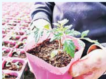
成育中のトマトの苗