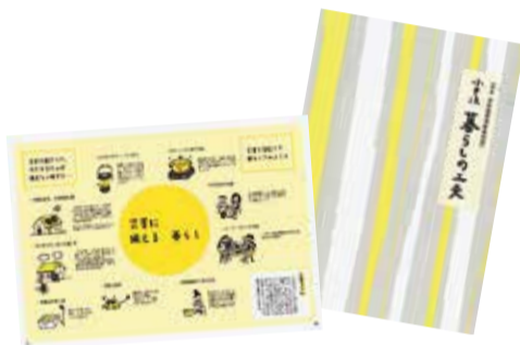
環境に優しい暮らし方を実現するためのさまざまなアイデアが盛り込まれた冊子を発行しています。

地球環境を良くしたいという思いで活動している団体です。小学校への出前授業やイベントの開催、ニュースや暮らしの工夫を発行しています。環境のために、一緒に活動しませんか。詳しくは、環境政策課へお問い合わせください。