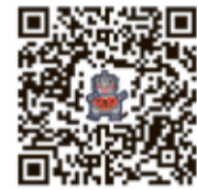
環境家計簿アプリ QRコード