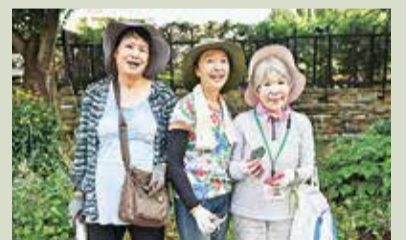
午前9時ごろから作業開始。長そで、手袋、虫よけ道具などで安全対策