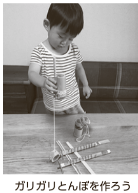
ガリガリとんぼを作ろう

※おひさまは子育て交流広場の愛称で、はらっぱは隣接の活動用スペースの愛称です。常設の乳幼児と保護者の遊び場です(火曜~土曜日の午前10時~午後6時)。