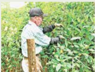
あじさい公園の生い茂ったあじさいのせん定