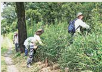
玉川上水自生野草保護区画の雑草刈り