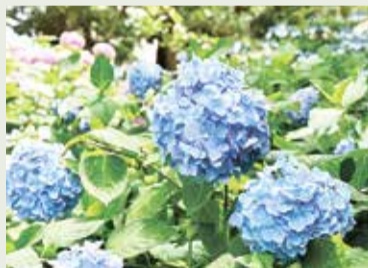
あじさい公園のあじさい

ボランティアは、部会ごとに活動して、玉川上水の自生野草保護区、狭山・堺緑道の花壇、あじさい公園など、決まった範囲内の管理をしています。