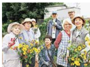
狭山・境緑道花街道ボランティア部会の皆さん

家の庭よりも大きい規模の花壇で花を育てられることが魅力です。夏は暑くて辛いこともありますが、仲間や通る人との会話を楽しみながら活動しています。園芸の知識が無くても、自然と学べます。仲間と一緒に楽しく活動しませんか。