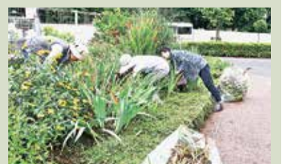
2時間程度、会話を楽しみながら手を動かし花壇を掃除しました