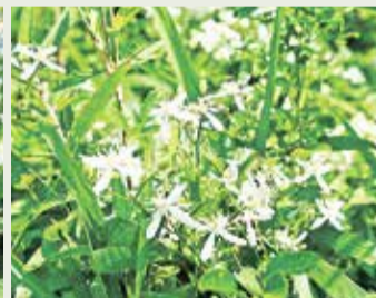
玉川上水自生野草保護区画のセンニンソウ