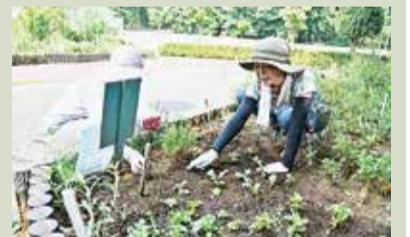
秋に咲く花の苗植えや雑草・枯れた草花を処分します