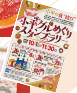
グルメぐりスタンプ台紙

参加店舗で300円以上の飲食や買い物をすると、スタンプを1個押ししてもらえます。スタンプを5個集めると、お城があるテーマパークのペアチケットや参加店舗で使えるグルメ券が当たる抽選に応募できます。スタンプ台紙は各参加店舗、市役所、市内公共施設で配布するほか、小平市ホームページからダウンロードもできます。