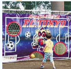
キックターゲット