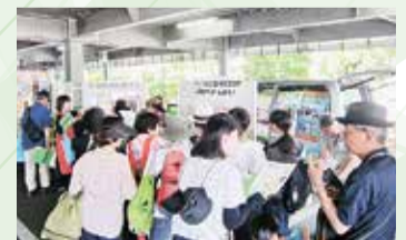
イベントへの出展