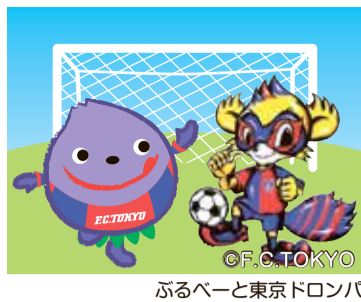
ふるべーと東京ドロンバ