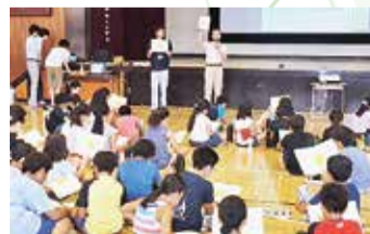
小学校への出前授業