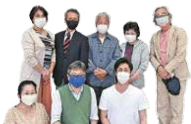
回田町会の皆さん

回田町会では、コロナ禍でイベントが開催できなくなったため、24時間使えるAED(自動体外除細動器)を設置しました。日々の不安が少しでも和らいでくれればという思いで、町内のAED設置場所や使用方法などをまとめた地図を作成し、町内全戸に配布しています。