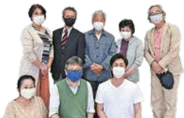
回田町会の皆さん

回田町会では、コロナ禍でイベントが開催できなくなったため、24時間使えるAED(自動体外除細動器)を設置しました。日々の不安が少しでも和らいでくれればという思いで、町内のAED設置場所や使用方法などをまとめた地図を作成し、町内全戸に配布しています。