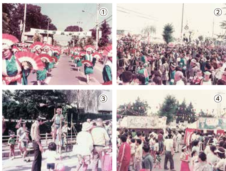
小平市民まつり第1回開催風景 ①民謡流し踊り、②みこし風景、③ちびっこ広場、④催しもの販売コーナー