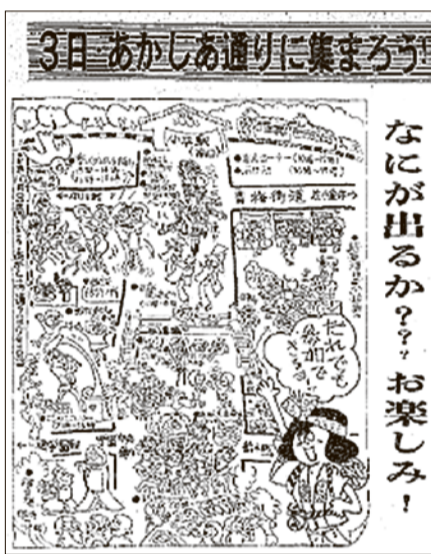
開催を伝える市報 昭和51年10月1日号

小平市民まつりは、毎年10月の第3日曜日に、あかしあ通りの仲町交差点から小平団地西交差点を会場として開催している、市内最大のお祭りです。昭和51年、市民の方々のつながりの強化と新しいふるさとづくりを目的に、市で初めて完成した都市計画道路のあかしあ通り(小平駅南口～学園中央通り間)で第1回小平市民まつりが開催されました。市民まつりの特徴は、来場者が見るだけでなく、一緒に参加して楽しめることです。かつては、社交ダンスやフォークダンスを踊ったり、みこしを一緒に担いだり、カラオケを歌ったりとさまざまな催しが行われていました。また、第1回(昭和51年)から第32回(平成19年)までは、あかしあ通りで民謡流し踊りが披露されていました。