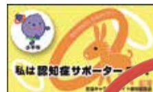
認知症サポーターの証です。