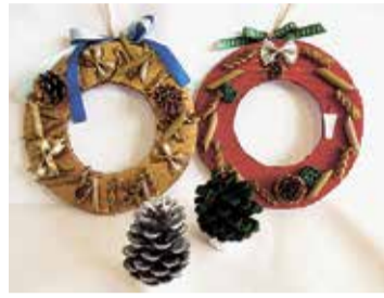
クリスマスリースを作ろう