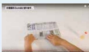
雑がみ回収袋の作り方

読み終わった市報で、雑がみ回収袋を作れます。作り方など、詳しくは、資源とごみの収集カレンダー・パンフレットをご覧ください。また、小平市ホームページ(右下QRコード)では、雑がみ回収袋の作り方を動画で紹介しています。ぜひご覧ください。