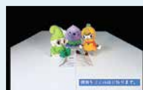
西東京市、小平市、清瀬市の市のキャラクターが作る雑がみ回収袋