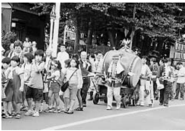
小平市郷土写真展 日程

図書館では、変わりゆく郷土の姿を記録するために、毎年テーマを決めて写真撮影・展示しています。今回は、伝統的なまじりを中心とした地域の夏まつりなどを撮影しました。あわせてこれまで収集した昭和30年～40年代の写真も展示します。ぜひ写真展にご来館ください。 主催 小平市教育委員会、小平市市民憲章推進協議会、ゆたかなまち専門部会 問合せ 喜平図書館 ☎042(345)1300