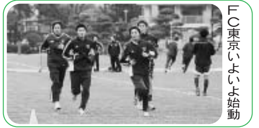
Fの東京いよいよ始動

第973号 発行：小平市 編集：企画財政部広報広聴課 〒187-8701 小平市小川町二丁目1333番地 ☎042(341)1211(代表)