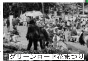
グリーンロード花まつり