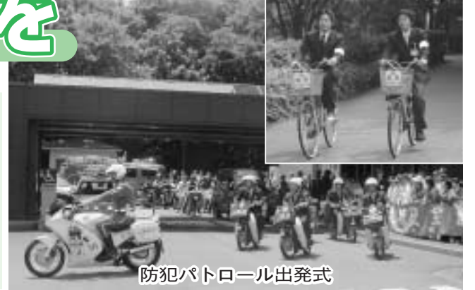
防犯パトロール出発式

市役所職員による防犯パトロールを開始しました。市では、安全・安心まちづくりの施策の一環として、市内における犯罪の未然防止の役割を担うため、市役所職員による「防犯パトロール」を5月24日(月)から始めました。