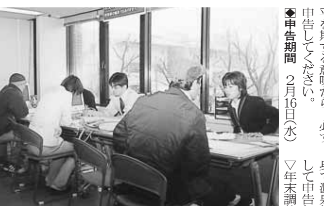
市民税・都民税の申告の受付状況。市民税・都民税の申告は、前年（平成16年）1月1日～12月31日）の所得を基礎に、今年の1月1日現在に居住する市町村で課税される税金で、税務署で受け付けている「所得税」とは異なります。