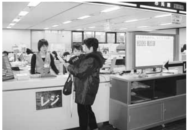
表2 出張所で取り扱う主な業務

※転入・転居の手続きは、住み始めてから14日以内に手続きをする必要があります。 ◆ 東部出張所・西部出張所 転入、転出の届け出などの市民課業務をはじめ、国民健康保険などさまざまな業務を取り扱っています(表2)。 ◆ 受付時間 は、午前8時30分から午後5時までです。 ◆ 動く市役所 市役所や出張所から遠い