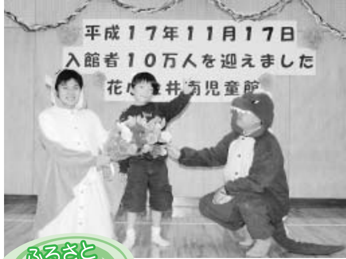
平成17年11月17日 入館者10万人を迎えました 花小金井南児童館

今年12月30日(金)まで通常どおり、ごみ・資源の収集を行います。収集が休みの期間のごみや資源は、自宅で保管してください。年始は1月4日(水)から収集を開始します。 年末年始は、大掃除などで特にごみや資源の量が大幅に増えます。しかし、捨てる前にもう一度、もう使えないかどうか、人に譲ることができないかどうか考えてみてください。 自治会を通じて、集積所掲示用「年末年始のごみ・資源収集カレンダー」を配布しています。マンションなど集合住宅の方にもお配りします。