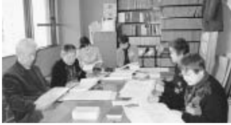
図書館ボランティアの活動

◇小平市ホームページ http://www.city.kodaira.tokyo.jp ◇電子メール info@city.kodaira.tokyo.jp ◇こだいらテレホンガイド ☎042(342)1222