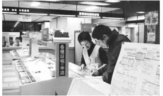
フロアで説明をする案内係

市では、窓口サービスのいっそうの向上を目指して、平成13年度から窓口サービスアンケートを実施しています。 今年度は、8月29日から9月16日まで、市役所、健康福祉事務センター、東部・西部出張所の窓口を利用された皆さんに、職員の接遇