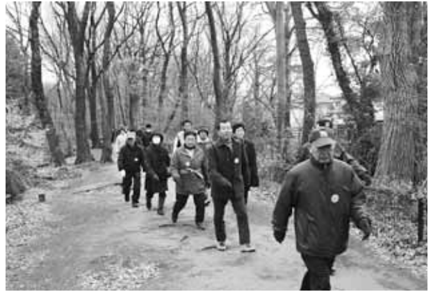
元旦歩け歩けのつどい コース